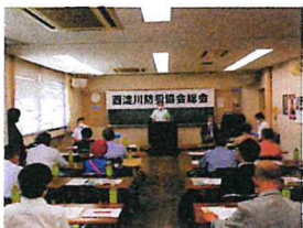
令和4年6月9日開催の「西淀川防犯協会総会」時の写真

特殊詐欺被害防止や子供女性被害防止など取り組むべき課題はありますが、地域住民が犯罪被害に遭わない、安全で安心して暮らせるまちづくりの実現に向けて、これからも地道に取り組んで参ります。