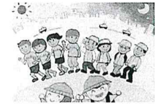
静岡県 藤井 有花(44歳)