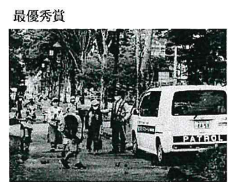
熊本県 吉並 和浩(61歳)