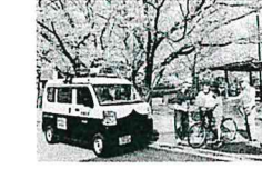
福岡県 山口 時子(59歳)