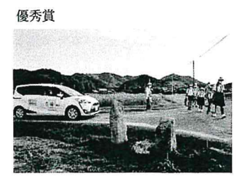
山口県 畑谷 久(70歳)