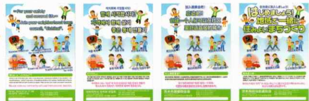
〈英語版〉 〈韓国語版〉 〈中国語版〉 〈日本語版〉

●茨木市自治会連合会では、「自治会加入案内ちらし」(A4版)、「自治会ハンドブック」(冊子)、「自治会ハンドブック概要版」(冊子)を作成しております。「自治会加入案内ちらし」(A4版)につきましては、今年度新たに、英語版、中国語版、韓国語版を作成しました。各自治会で未加入世帯や、在住外国人の方々に加入案内される際にぜひご活用ください。