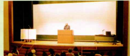
自治会長説明会の様子

この説明会は、平成23年度から実施しているもので、自治会などの1年間のおおまかなスケジュール、自治会への支援や個人情報の取扱などについてお話しします。 新任に限らず ご参加いただくことができます。