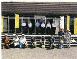
「熊取町わんだふるくらぶ」へのバンドナ贈呈式

泉佐野 泉佐野警察署管内防犯協議会では、泉佐野警察署、自治体、事業所、関係団体と連携した防犯活動に取り組んでいます。 特に特殊詐欺被害防止活動として、自治体の介護福祉課等を通してチラシを配布したり、年金支給日に管内の金融機関と協働し、啓発物を配布する等の広報啓発活動を実施しています。 また、長年、地域の防犯活動に取り組んでいる「わんわんパトロール隊」に対し、夏休み期間中の子ども安全見守り活動を依頼し、パトロール犬に新しいバンドナを贈呈しました。 今後も、コロナ感染防止に留意しつつ、効果的な防犯活動を実施して参ります。